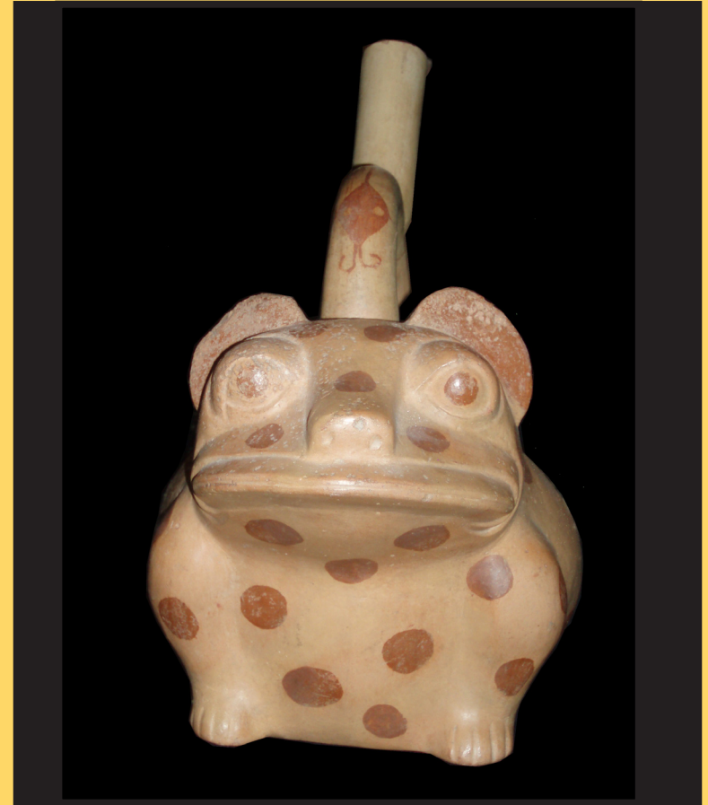
Botijo en forma de rana (musée d'Auch)

Lycée d'hôtellerie et de tourisme d'Occitanie Toulouse