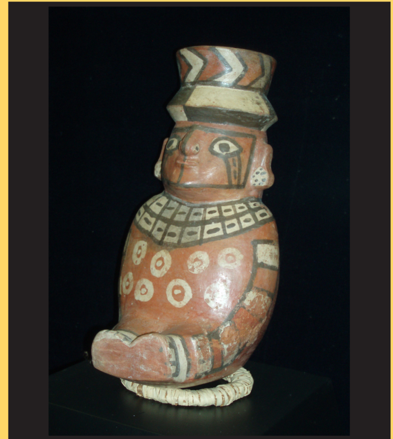
Vasija antropomorfa (musée d'Auch)

Lycée d'hôtellerie et de tourisme d'Occitanie Toulouse