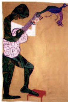
▲ Arpillera «Hombre con guitarra».

De los 10 hermanos Parra, 7 fueron artistas. El hermano mayor de Violeta, Nicanor Parra (1914) es uno de los grandes poetas chilenos, premio Cervantes de 2011. Hilda (1914-1975) era cantante del dúo «Las Hermanas Parra». La segunda generación, Isabel y Ángel, también se dedica a la música y la tradición perdura con la tercera generación.