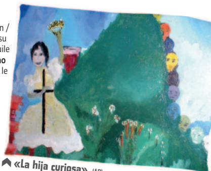
▲ «La hija curiosa».

el tema le titre, la chanson / arpillera ici peinture sur tissu / el óleo la peinture à l'huile / bordar broder / lo mismo la même chose / la carpa le chapiteau.