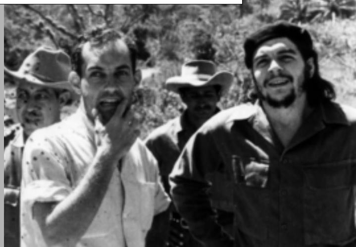
Avec le Che pendant le tournage de Historias de la revolución (1960)

À L'ATTENTION DU CONSEIL DE DIRECTION DE L'ICAIC