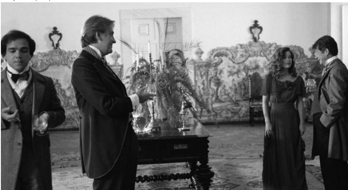
L'œil qui ment (1992)

Vygotski, el soviético conocido como el Mozart de la neurología rusa, descubrió todo sin instrumento; nadie entiende como hizo. Lo que teorizó con un siglo de adelanto se demuestra hoy. Hay que decir que había muchos cadáveres, muchos enfermos, muchas cabezas abiertas, era la guerra. Hizo experimentos que encuentro cercanos al cine, tests de percepción visual sobre las formas geométricas y la combinación de esas formas con el mundo real. ¡Es por lo tanto uno de los primeros que teoriza sin saberlo sobre el Cubismo! Trabajó sobre las relaciones del lenguaje y del pensamiento. Su texto más famoso se llama Pensamiento y lenguaje 12 . En dos palabras, es complementario de otro científico, Stanislaw Ulam, un matemático polaco. Ulam explica que el pensamiento científico, que está cerca del pensamiento artístico, procede por cadenas de ideogramas simples, visuales, o sea imágenes. Esas imágenes se entrelazan y atacan ortogonalmente el lenguaje natural, es decir, el lenguaje que usamos para hablar y con el que no podemos pensar creativamente porque es demasiado lento. Ese lenguaje natural es por supuesto indispensable, sin él no podríamos vivir. El pensamiento creativo está constituido por imá-