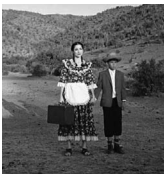
La recta provincia, 2007