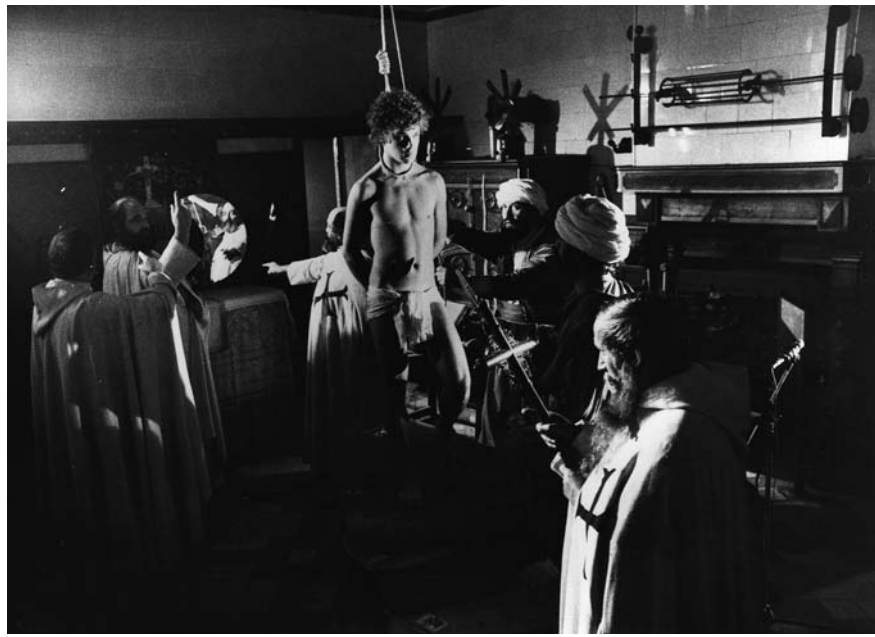
L'hypothèse du tableau volé (1979)

RR Il y a là encore un malentendu du langage. On parle de cinéma, on parle de tous les cinémas, et quand on parle de tous les cinémas c’est comme si on cherchait à faire une théorie générale de la typographie ou des livres. Je parle d’un certain type de cinéma que je pratique. C’est ma poétique, et mon idée c’est que chacun cherche sa poétique, sa démarche. Dans mon travail pédagogique, je ne cherche pas à imposer mes idées, c’est pour cela qu’elles sont assez farfelues, assez glissantes si j’ose dire. Je ne cherche pas à parler de “tout” le cinéma. Dans toutes les démarches qui existent, il y a un cinéma qui exige la démonstration. Un certain type de cinéma politique, Mondovino (2004) par exemple. On peut penser ce qu’on veut des films démonstratifs, c’est une manière de faire. Mais la démonstration peut-être d’un autre type. Quand Antonioni, dans L’éclipse (1962), je crois, filme et montre le fonctionnement de la Bourse, pendant quinze minutes qu’à l’époque on trouvait ennuyeuses, c’est une des critiques les plus radicales de l’économie de marché. Il n’y a pas un mot, ni pour ni contre. Il n’y a pas de commentaires. Il y a simplement une vision