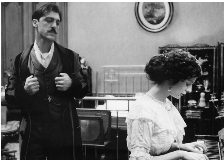
Le temps retrouvé, 1999

Estoy preparando una película que se llama Love and virtue acerca del personaje de Roland. Es una adaptación de La chanson de Roland más Orlando innamorato y Orlando furioso 9 . Hay tres siglos entre los dos y Ariosto lo cambió todo. En La chanson de Roland , a Roland lo matan los vascos, lo que aparentemente es cierto; en La chanson , es el sobrino de Carlomagno mientras que no lo era, y para terminar Europa es un completo disparate: los sarracenos están en España, los chinos en Alemania o no muy lejos, Orlando se enamora de la hija del rey de Catai, Virginie Ledoyen. El rey de Catai no es chino, es algo