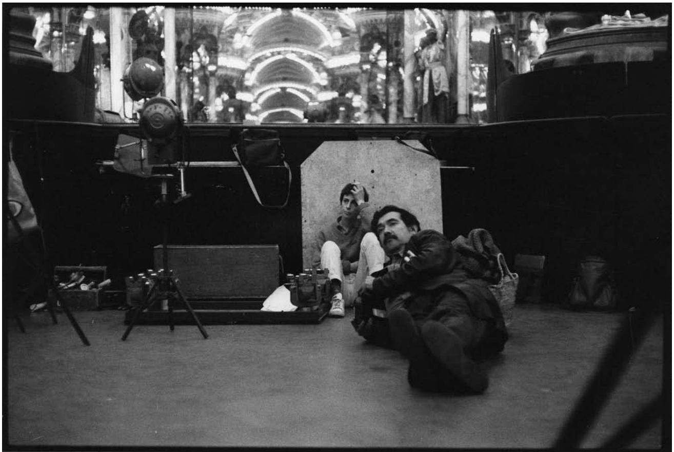
Tournage de Les trois couronnes du matelot (1983)

va jusqu'à Mao Zedong : les quatorze devoirs d'un bon révolutionnaire, les six calamités, les vingt-quatre manières de faire un bon poème, les vingt-deux manières de regarder un paysage. Ce sont toujours des chiffres précis et des listes exhaustives. Ces listes sont hétéroclites et disparates. Vous connaissez certainement Les mots et les choses (1966) de Michel Foucault : ça commence par une liste hétéroclite chinoise citée par Borges. C'est une blague. Or ce que ne savait pas Borges, c'est que les listes chinoises sont aussi des blagues parce que le rire est un instrument philosophique. Ces listes ont commencé par des blagues et se sont terminées par des choses plutôt sérieuses comme les listes taoïstes.