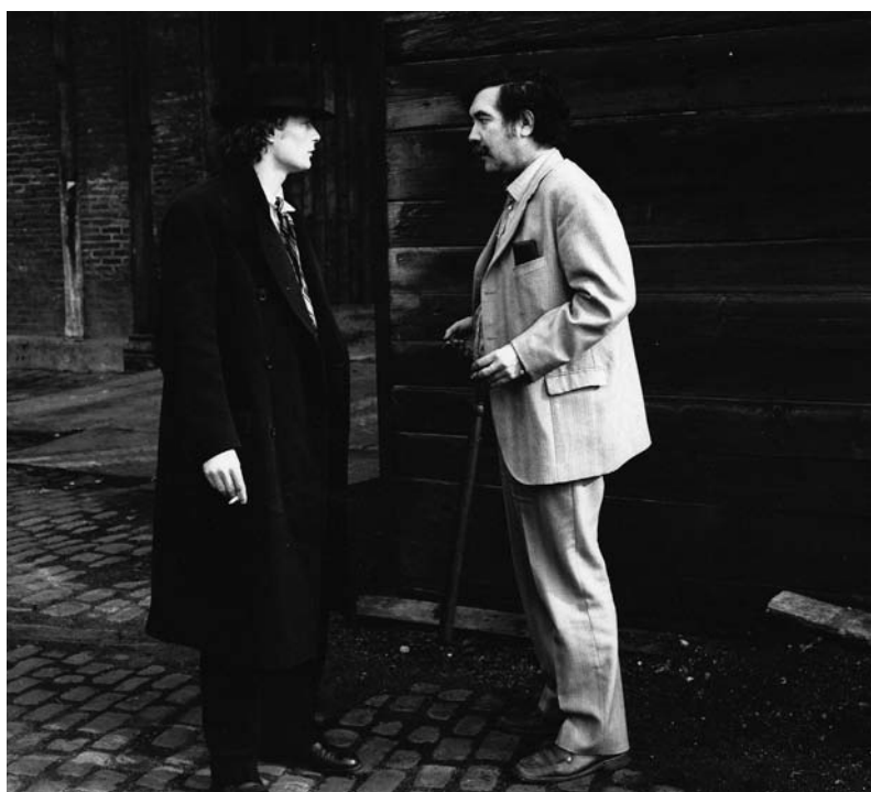
Tournage de Les trois couronnes du matelot (1983)

Staline était un peu capricieux. À l'École des Beaux-arts de Moscou, il dit "un film c'est un livre feuilleté à toute vitesse". Un mot, un mot, une ligne, un autre mot... et vous feuillotez dans les deux sens! Il y a cette séquentialité, mais il y a le hasard. Donc il n'y a pas de cinéma exhaustif. Le cinéma est toujours une perception éparpillée.